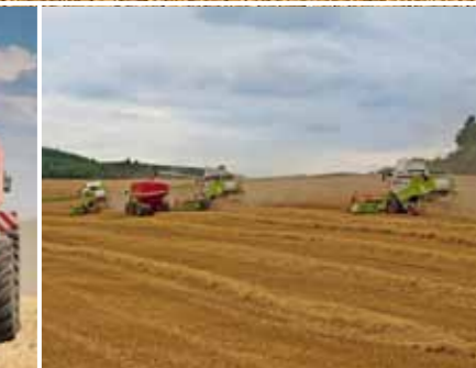
Didžiausias efektyvumas naudojant Titan 34 UW su trimis kombainais.