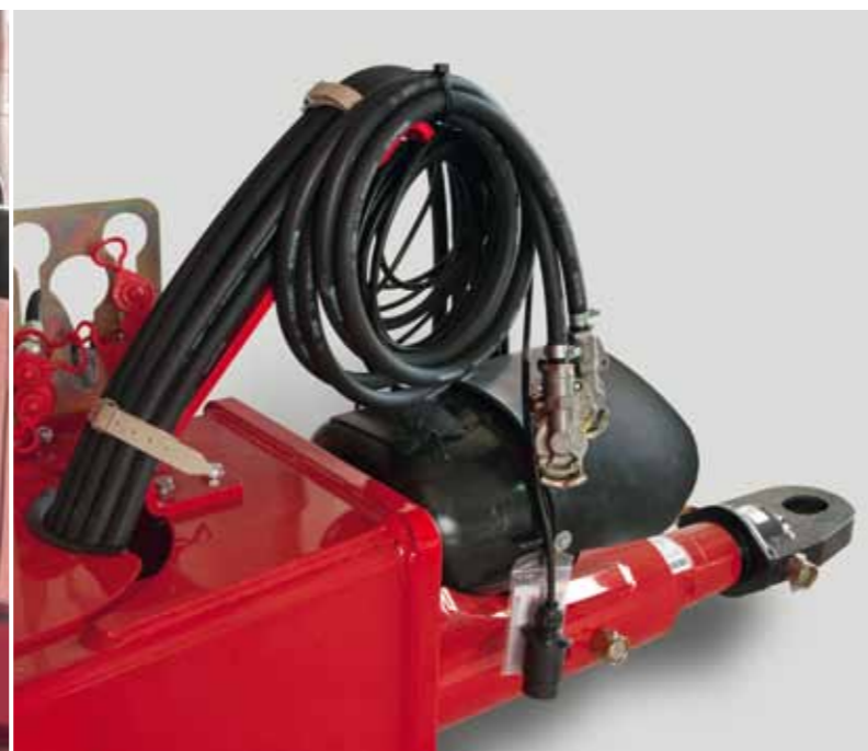
Prikabinimo mechanizmas yra standartinis – kitokie prikabinimai taip pat galimi, pagal kliento poreikius