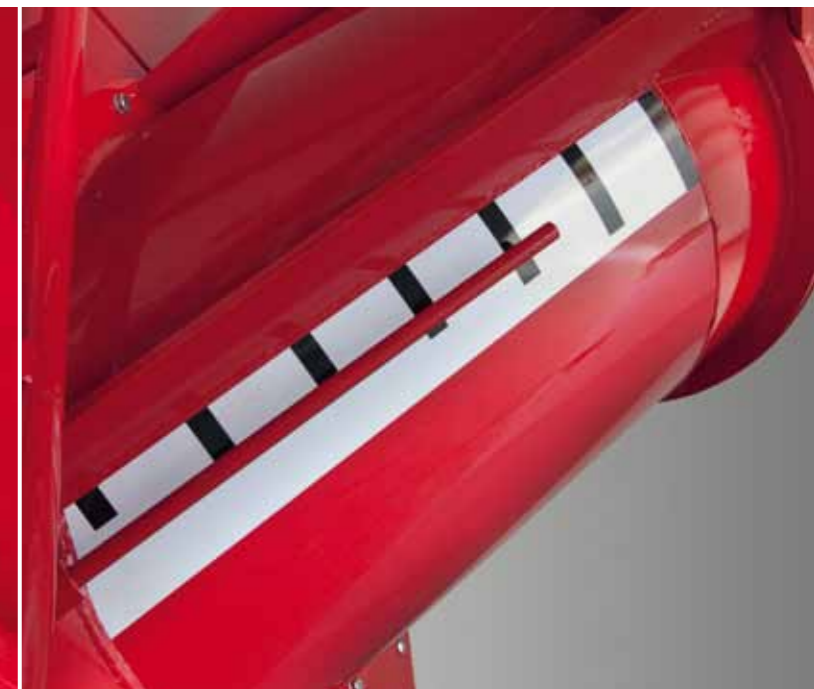
Sraigės uždarymo sklendės padėties rodyklė yra nesunkiai matoma iš traktoriaus kabinos