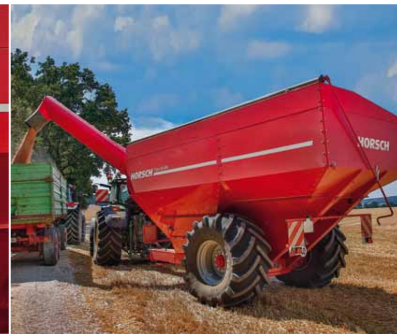
Titanas turi optimalų iškrovimo aukštį siekiantį 4,6 m.