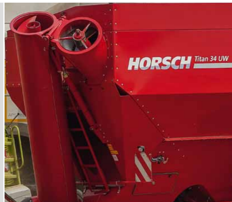
Iškrovimo sraigės našumas yra 18 t/min, todėl visas 34 kubinių metrų talpos bunkeris yra iškraunamas tik per 90 sekundžių.