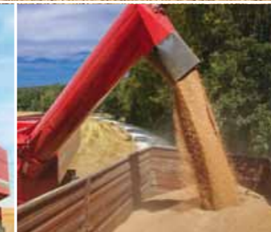
Naujai sukurtos iškrovimo sraigės našumas (600 mm diametras) yra 18 t/min. – t.y. 1.000 t/h.