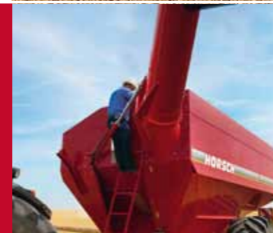
Kopetėlės užtikrina priėjimą prie bunkerio bei į jo vidų, kad atlikti būtiniausius darbus.

„Ne taip, kaip tai buvo prieš 10 metų, Titan 34 UW nėra importuojamas iš JAV, dabar jis gaminamas čia. Taip nutiko todėl, kad padidėjo gamybos apimtys. Su Titan 34 UW buvo patenkinti visi pagrindiniai ūkininkų keliami reikalavimai – bunkerio talpa, greitas perkrovimas bei paprastas valdymas.“