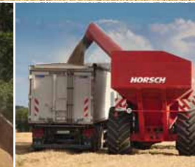
Padidintas stabilumas bei dirvos suspaudimo sumažinimas dėka teleskopinės galinės ašies