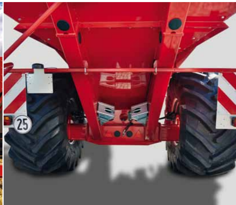
Teleskopinė galinė ašis padidina plotį nuo 3 iki 3,56 metro, tai užtikrina didesnį stabilumą, bei mažiau spaudžia dirvą.