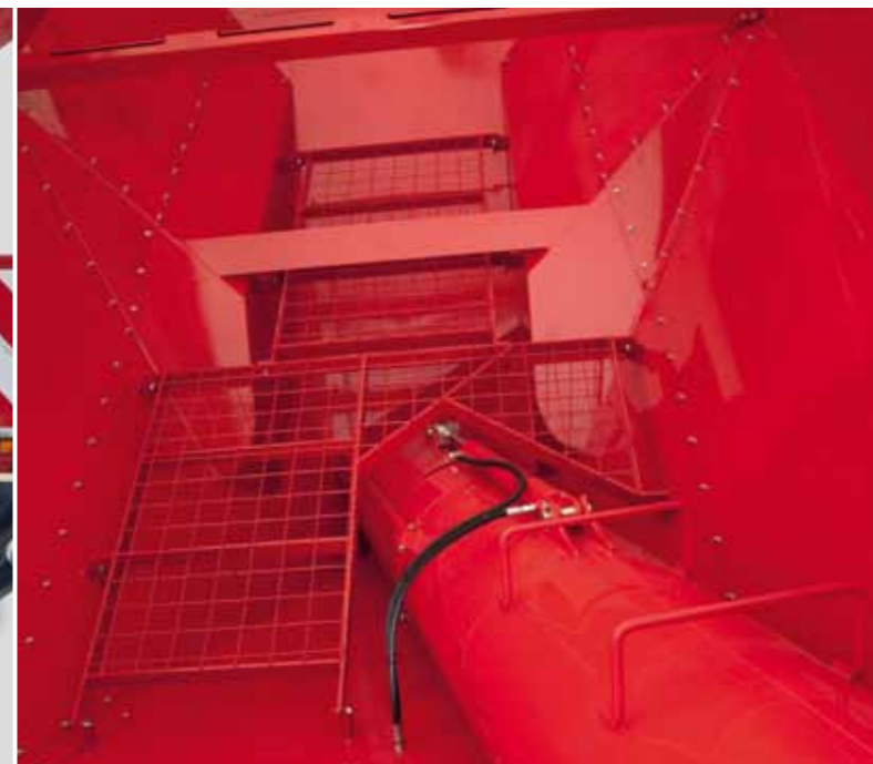
Bunkerio vidus yra lengvai pasiekiamas, bei prieinamas atliekant valymo darbus.