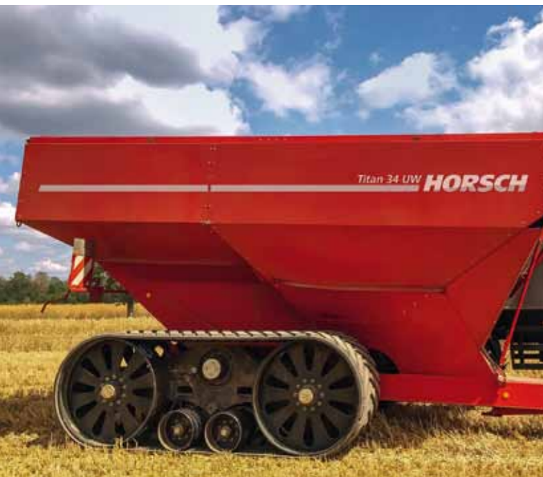
Galima rinktis vikšrinę važiuoklę, tada spaudimas į dirvą bus mažesnis. (4,2 m 2 plotas)