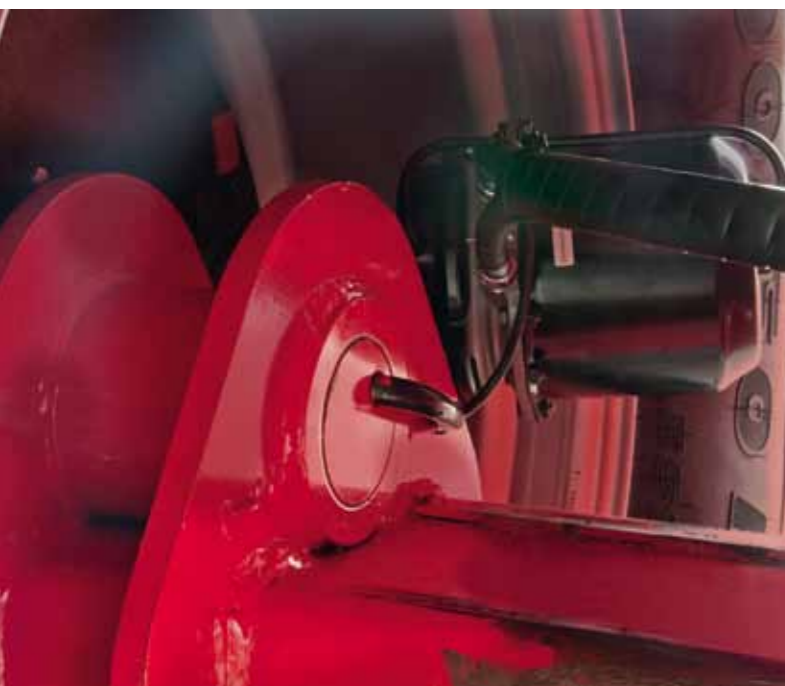
Kompensacinėje priekaboje gali būti įrengti hidrauliniai ar pneumatiniai stabdžiai.